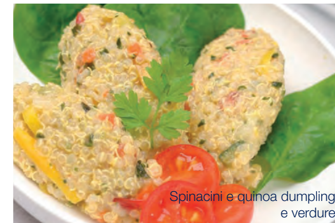
Spinacini e quinoa dumpling e verdure