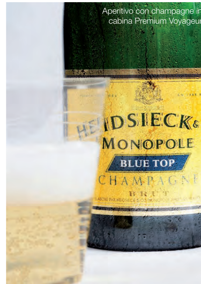
Aperitivo con champagne in cabina Premium Voyageur

Air France, inoltre, sui suoi voli a lungo raggio (ad eccezione delle destinazioni dei Caraibi e dell'Oceano Indiano) offre champagne in tutte le cabine.