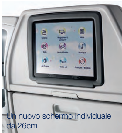
Un nuovo schermo individuale da 26cm

Il grande video personale a disposizione dei passeggeri Premium Voyageur misura 10,4 pollici (26 centimetri) di larghezza, per godere appieno della visione di ben 85 film disponibili, alcuni dei quali in 9 lingue diverse*.