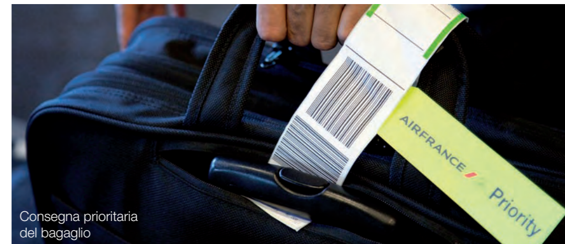
Consegna prioritaria del bagaglio

Come per i passeggeri di classe Affaires (business), i clienti Premium Voyageur possono imbarcarsi sul volo in qualsiasi momento e, all'arrivo, sono tra i primi a sbarcare ed a ricevere i bagagli.