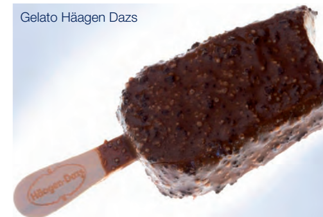
Gelato Häagen Dazs